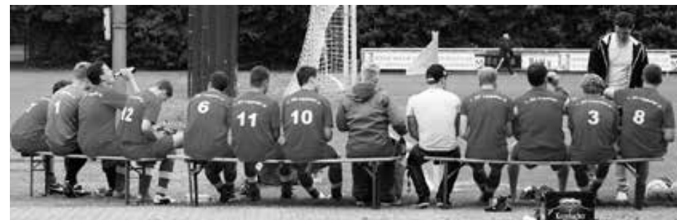
„Nichtabstiegshelden at work!“