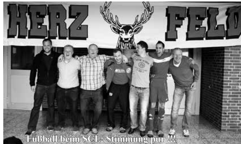
Fußball beim SCL: Stimmung pur !!!

Die Saison ist gespielt und die sportliche Bilanz sieht zufriedenstellend aus. Ein Aufstieg sprang in diesem Jahr zwar nicht heraus, doch haben sich alle SCL-Seniorenmannschaften anständig verkauft, so dass die Rot-Weißen mit einem hervorragenden Ruf aus dem Kreis Beckum verabschiedet wurden.